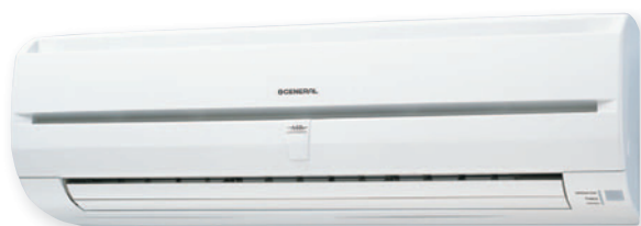
ASH7U, ASH9U ASH12U