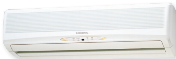
ASG18U, ASG24U ASG30U